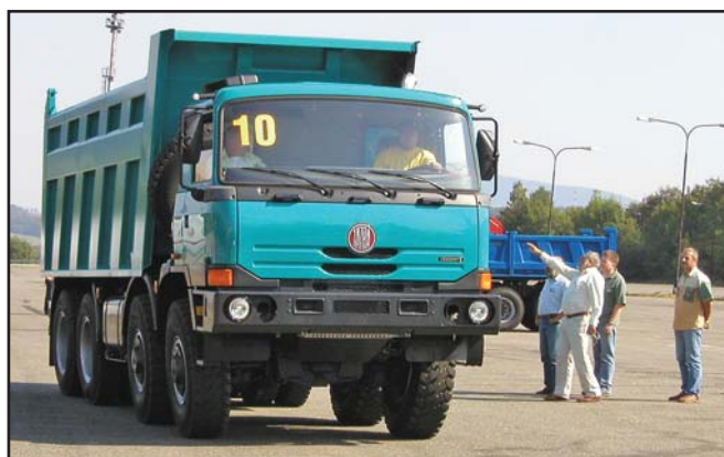
Největší atrakcí byly jízd. Někdo chtěl řídit sám, někdo se zase raději svěřil profesionálům.