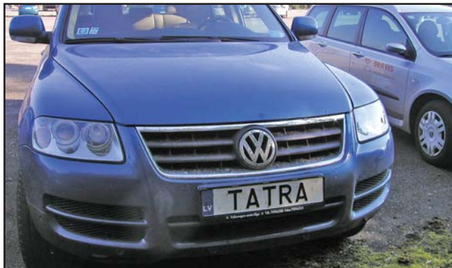
Kam až může sahat fandovství pro značku TATRA? Lotyšský dealer Jurij Čeverda to vyřešil zcela originálně. U nás v Česku bychom však s touto SPZ na dopravním inspektorátu zřejmě neuspěli.