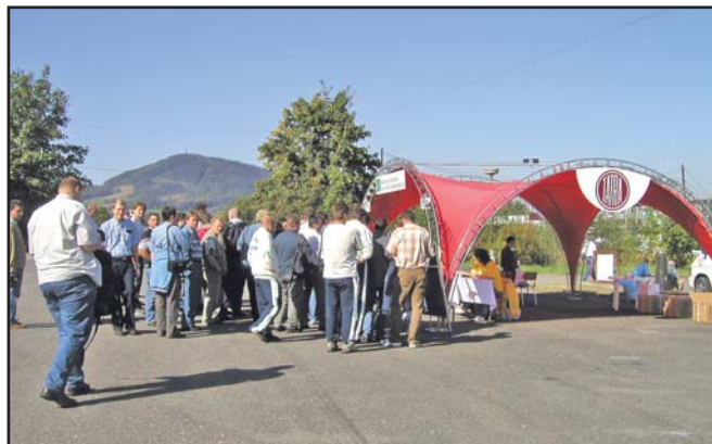
Červený stan sloužil k registraci a tady si také účastníci „Open day“ plánovali svůj program jízd i prohlídek provozů.