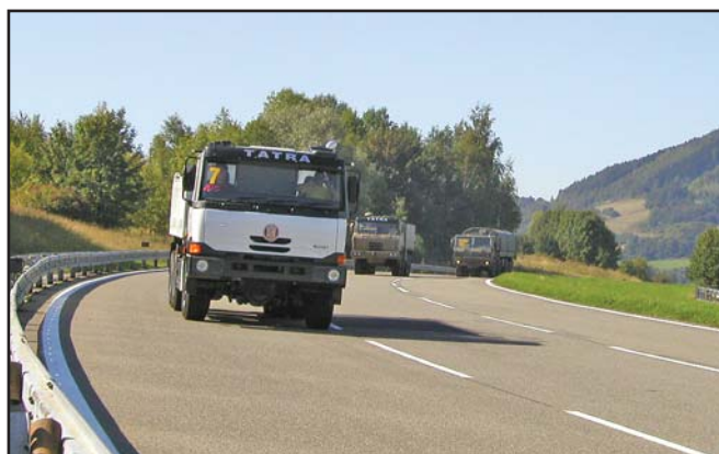
Dráhy polygonu byly mnohdy plně obsazeny.