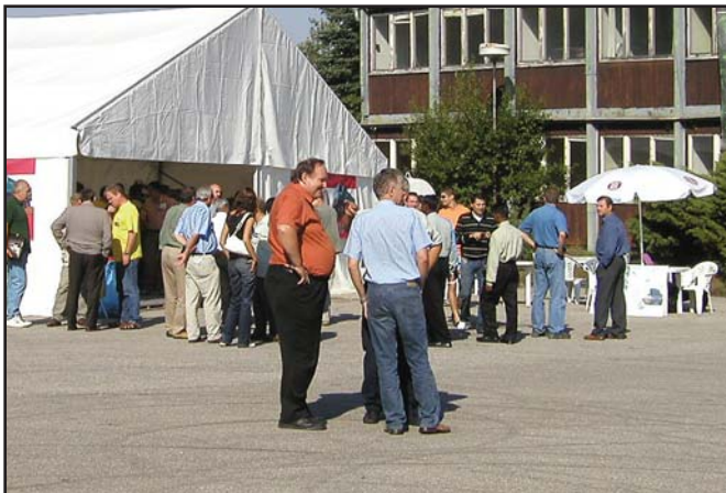
Třídenní akci provázela celá řada formálních i neformálních jednání.