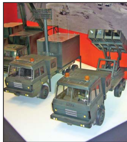
Bylo viděno na Defendory: Model vozidla T815-26RR36 s nástavbou kompletu Spyder ve stánku izraelské firmy Rafael, na snímku dole model tatrovky T815-6ZVR8T 10x10 s nástavbou Motoviliča ve stánku firmy Rosoboronexport v oficiální expozici Ruské federace.