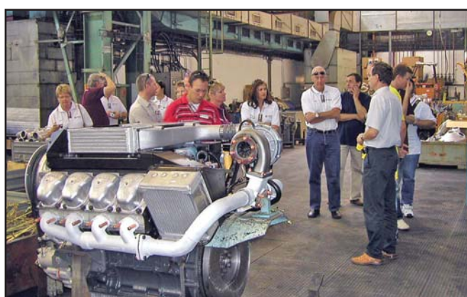
Hosté při prohlídce našich pracovišť. Tito jsou až z Austrálie.