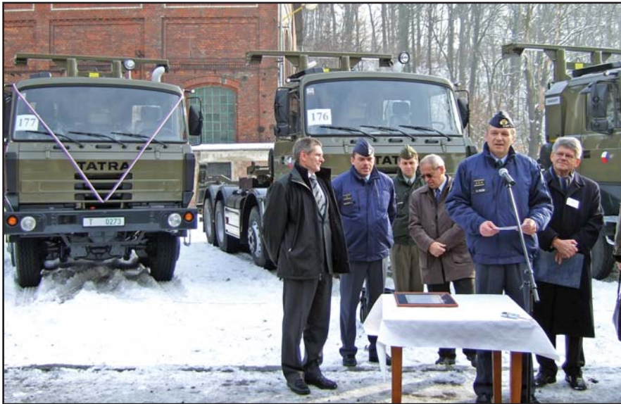
V areálu Hornického muzea OKD převzal náčelník Generálního štábu Armády ČR generálporučík Vlastimil Pícek 177. Tatra Multilift (na snímku při slavnostním projevu). Po jeho levici stojí Ludvík Semerák, výkonný ředitel OKD, Doprava a na snímku zcela vlevo je Jiří Hýnek, prezident Asociace obranného průmyslu ČR, který vyjádřil záměr nabízet kontejnerové nakladače také armádám jiných států. Bližší informace na straně 5.