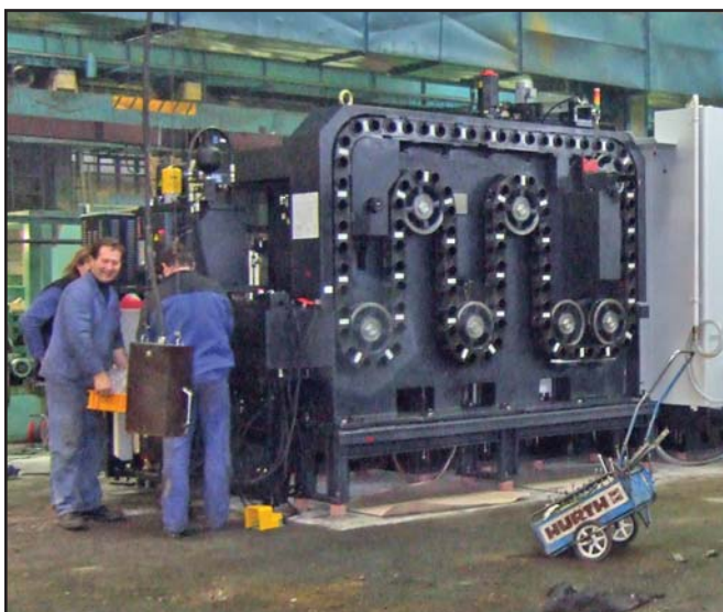
V závěru listopadu začala instalace dvou nových obráběcích center pro výrobu příčniců v objektu 320.

Kromě nových technologií Tatra investovala v posledním období také do generálních oprav strojů. Jednalo se například o tři CNC obráběcí stroje pro výrobu ozubených kol na středisku 4162. (ebo)